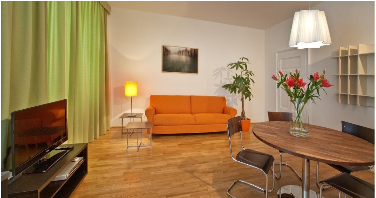
Wohnraum des Apartments 17 mit Blick in den Innenhof über die Fenster auf der linken Seite; stimmige, gemütliche Atmosphäre in einem historischen Wiener Biedermeierhaus