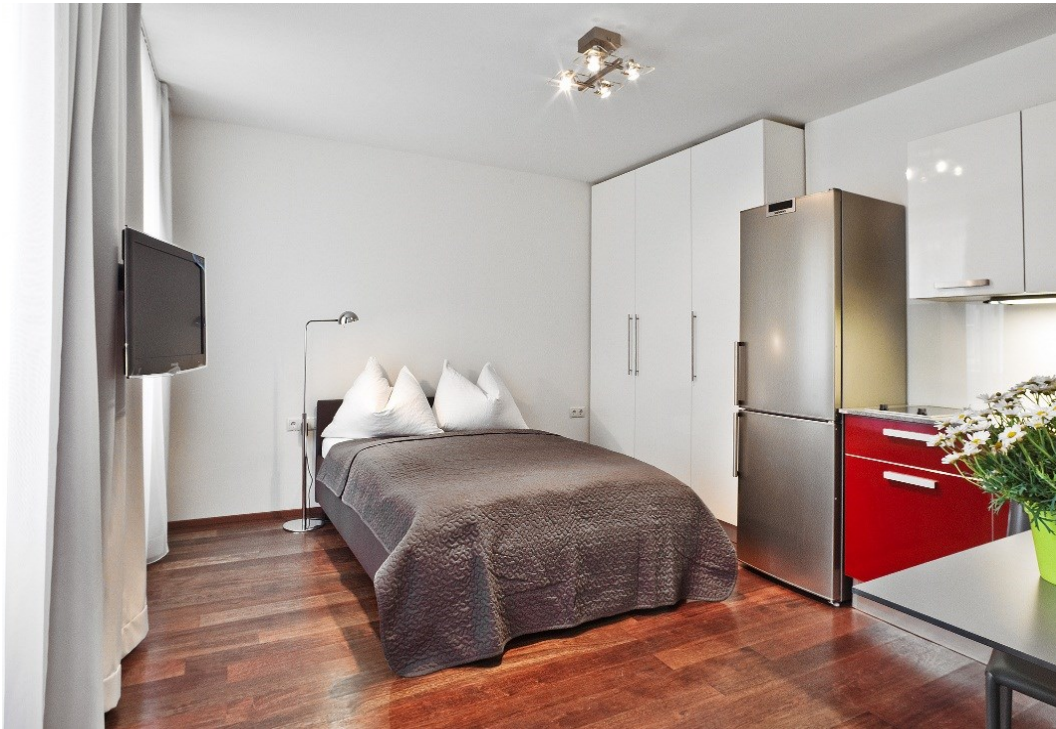
Apartment 15 Diese Einheiten sind hell und gemütlich. Sie haben einen Wohn-Schlafraum, Küche, Bad mit Dusche und getrenntes WC. Grundpreis 1195 € / Monat.