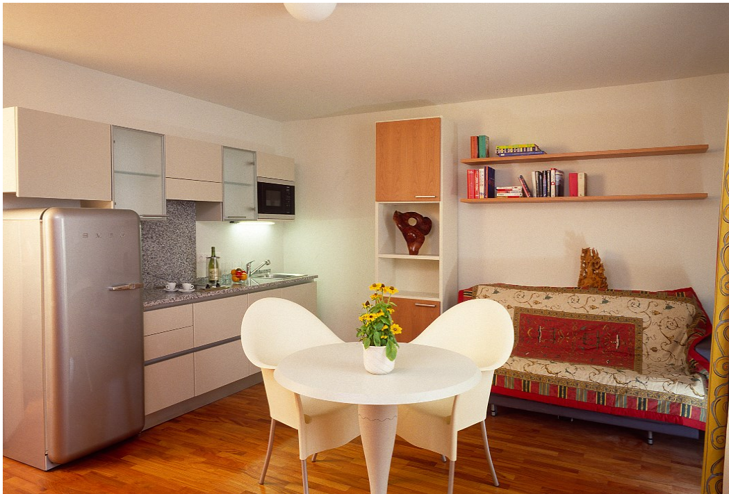
Stilvoll eingerichteter Wohn-/Schlafraum mit Designermöbeln und moderner Küche, mit Blick in den begrünten Innenhof. Badezimmer mit Dusche sowie separates WC. Grundpreis: 1.195 Euro pro Monat.