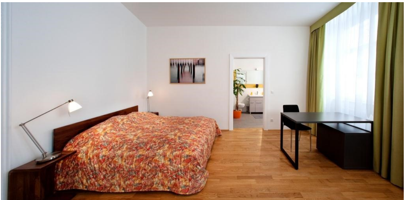
Geräumiges, ruhiges Schlafzimmer des Apartments 17; im Hintergrund das Badezimmer mit Dusche, Waschtisch und Waschmaschine. Preis: 1.790 Euro pro Monat.